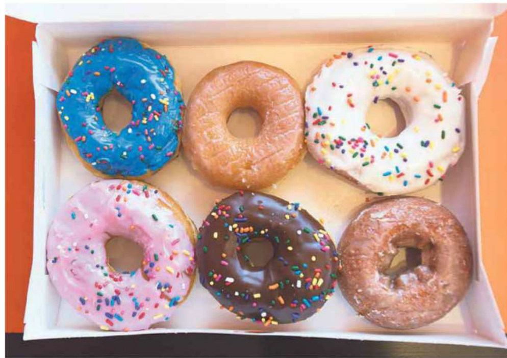
Labumu grozs briest gan Latvijā, gan pasaulē. ASV un Rietumeiropā augstākā līmeņa vadītāju atalgojums gadā pārsniedz summu ar vairākām nullēm.

Gan pasaulē, gan Latvijā palielinās augstākā līmeņa vadītāju vidējā pamatalga un mainīgo lielumu atbildība jeb tā dēvētais labumu grozs; maciņi kļuvuši biežāki finanšu un IT uzņēmumu vadītājiem